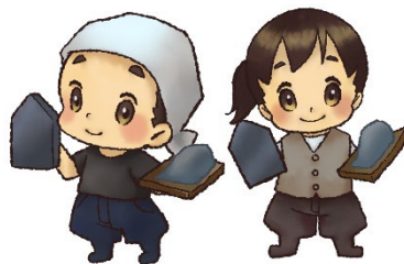
左官タイル施工科